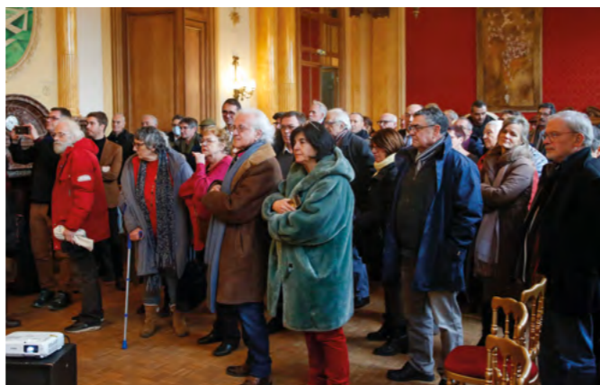
De très nombreux-ses Romainvillois-es ont participé à l'hommage.