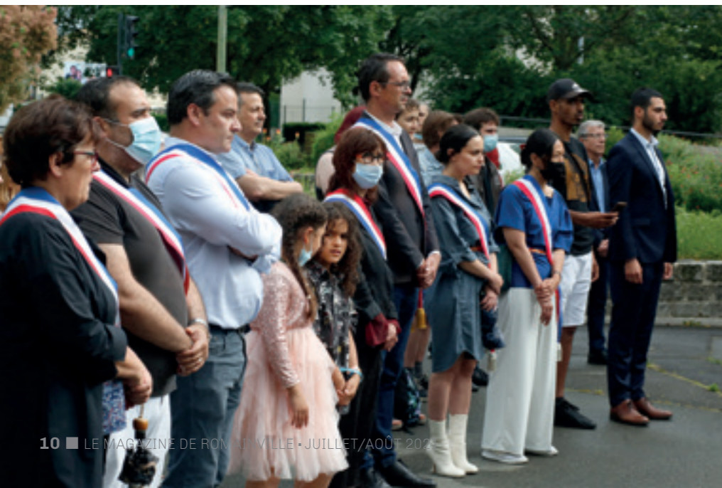
■ Les plaques Jacques Duclos, Maurice Thorez et la stèle Jean Moulin ont été fleuries en amont de la cérémonie qui s'est conclue par la diffusion de l'hymne national.