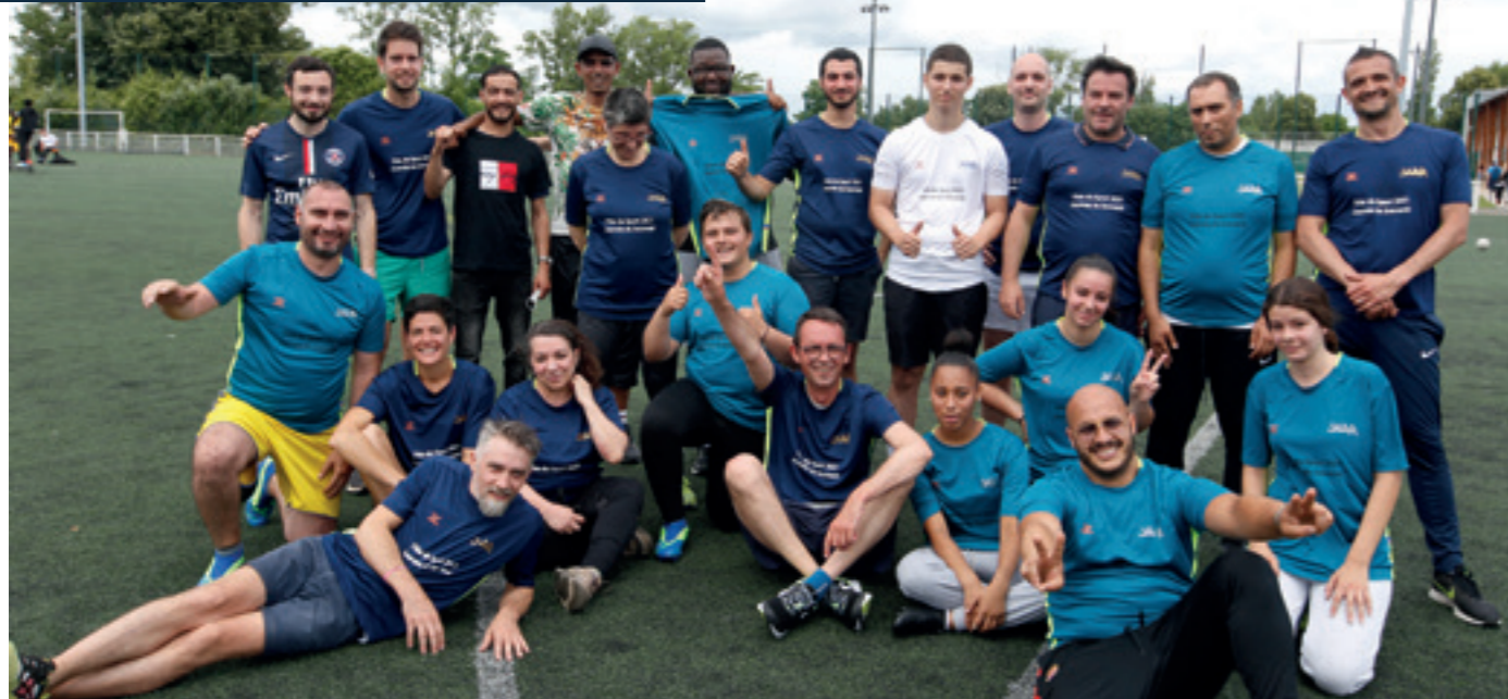
■ Au complexe Paul Baldit, à l'occasion de la Journée du Souvenir, l'association JARR a convié les élu-e-s à disputer un match de football amical dans la bonne humeur.