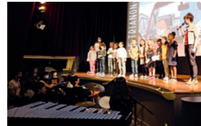
■ Le samedi suivant, les « Classes Image » de CP de l'école élémentaire Marcel-Cachin et la classe de 5 e CHAM (classe à horaires aménagés musique) du conservatoire Nina Simone ont joué en direct et en semi-improvisation pendant la projection de quatre courts-métrages d'animation avant de présenter La Vie de Château , un film d'animation aux décors somptueux.