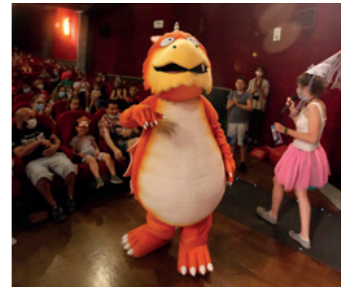
■ Invité surprise, Zébulon en personne est venu saluer les enfants et leurs parents !