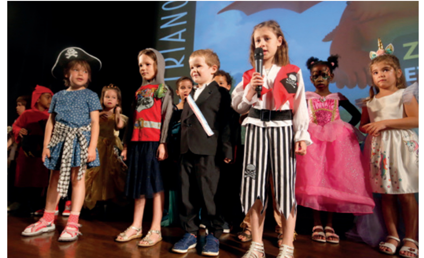
■ Le samedi 19 juin, les élèves de grande section de l'école maternelle Danielle Casanova ont présenté, en avant-première, le film d'animation Zébulon le dragon et les médecins volants. Une occasion idéale pour les jeunes cinéphiles du dispositif « Classes Image » d'enfiler leurs plus beaux déguisements.

La 23 e édition du festival "Les enfants font leur cinéma", concoctée par les enfants du dispositif Classes Image, s'est déroulée au Trianon du 18 au 27 juin. Au programme; des spectacles, des concerts, des projections, et bien sûr... des surprises !