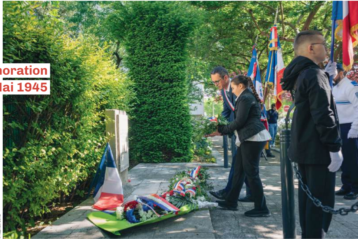
8 mai : Les élu-e-s de Romainville et les associations d'ancien-ne-s combattant-e-s, résistant-e-s, déporté-e-s et familles de fusillé-e-s, des jeunes du collège Gustave Courbet ont commémoré la Victoire des Alliés sur l'Allemagne nazie et la fin de la Seconde Guerre mondiale.