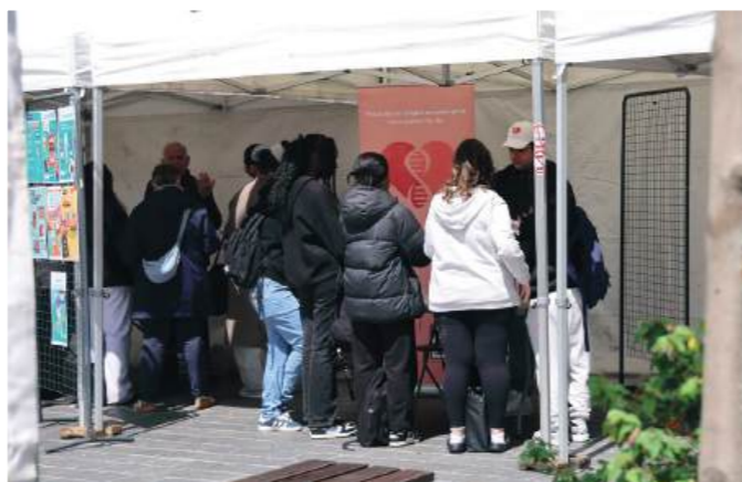
Du 11 au 13 mai : Grâce à la Mammobile stationnée place de la Laïcité, la CPAM du 93 a proposé des dépistages gratuits des cancers du sein, du col de l'utérus et colorectal. Le 11 mai, toujours place de la Laïcité, la Ville organisait un Forum Santé pour informer, sensibiliser et échanger autour de la santé des jeunes.