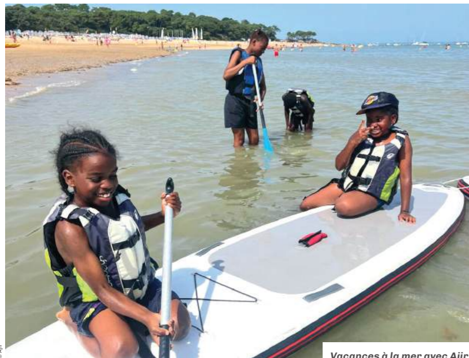
Vacances à la mer avec Ajir.