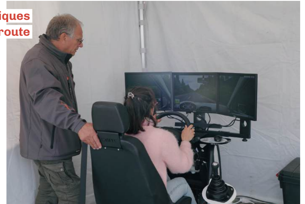
13 mai : Nouvelle édition de la Journée de la prévention routière, place de la Laïcité. Avec la Police municipale, petit-e-s et grand-e-s ont participé à différentes animations et ateliers de sensibilisation sur la sécurité et les risques au volant.