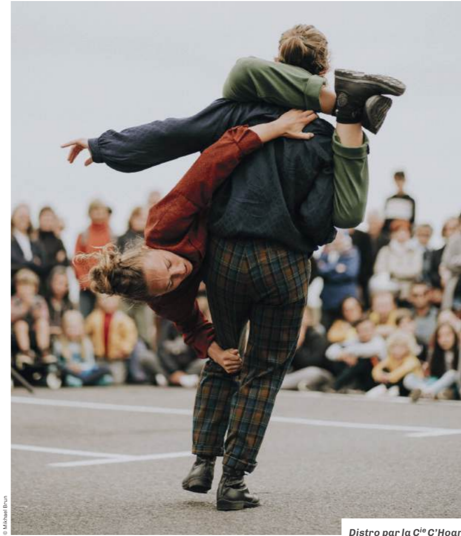
Distro par la C ie C'Hoari.

Organisée par la Ville de Pantin, avec Romainville, Les Lilas, Le Pré Saint-Gervais, Noisy-le-Sec, Bondy et Bobigny, la Biennale Urbaine des Spectacles (BUS) revient, pour la 8 e édition, clôturer la saison culturelle et lancer l'été en beauté !