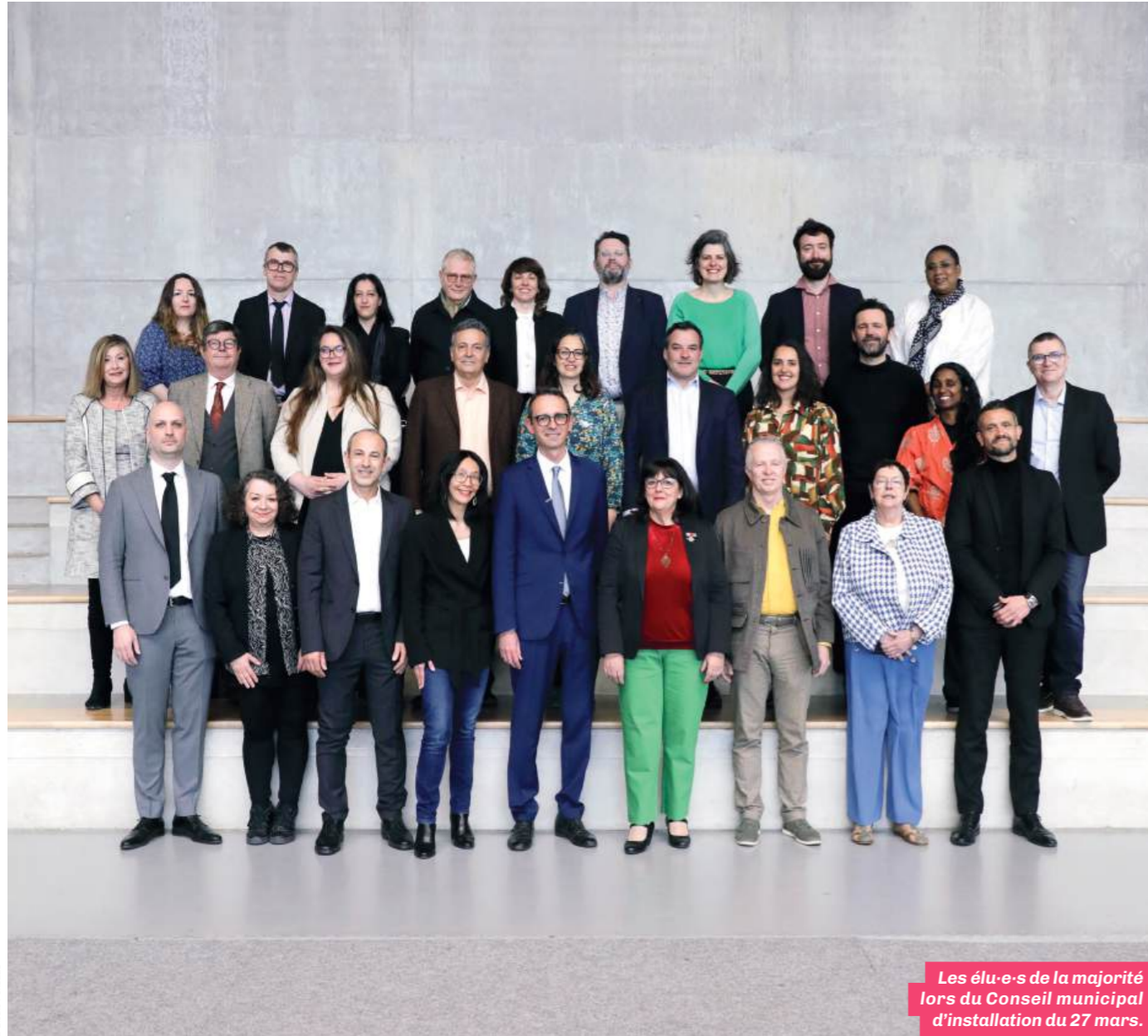
Les élu-e-s de la majorité lors du Conseil municipal d'installation du 27 mars.