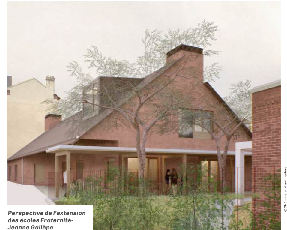
Perspective de l'extension des écoles Fraternité-Jeanne Gallèpe.

Au rez-de-chaussée, on trouvera une loge de gardien, un espace d'accueil, et surtout le réfectoire dédié à l'école maternelle Jeanne-Gallèpe, largement vitré et orienté vers la cour. Celui-ci se situera à côté de la nouvelle cuisine de production (et non plus une simple cuisine de réchauffage), après celles, déjà ouverte de Maryse Bastié et en devenir à Charcot-Barbusse. Elle desservira également le réfectoire existant de l'école élémentaire Fraternité : un pas-