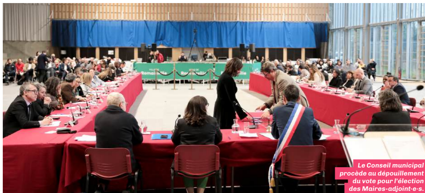
Le Conseil municipal procède au dépouillement du vote pour l'élection des Maires-adjoint-e-s.