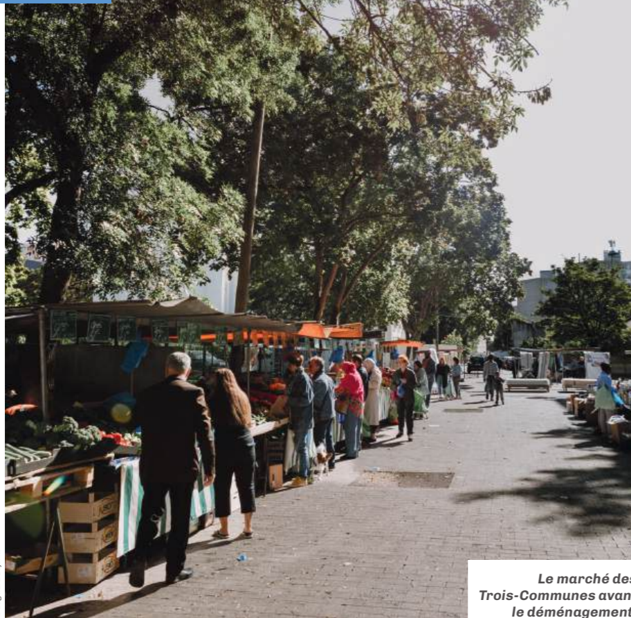
Le marché des Trois-Communes avant le déménagement.