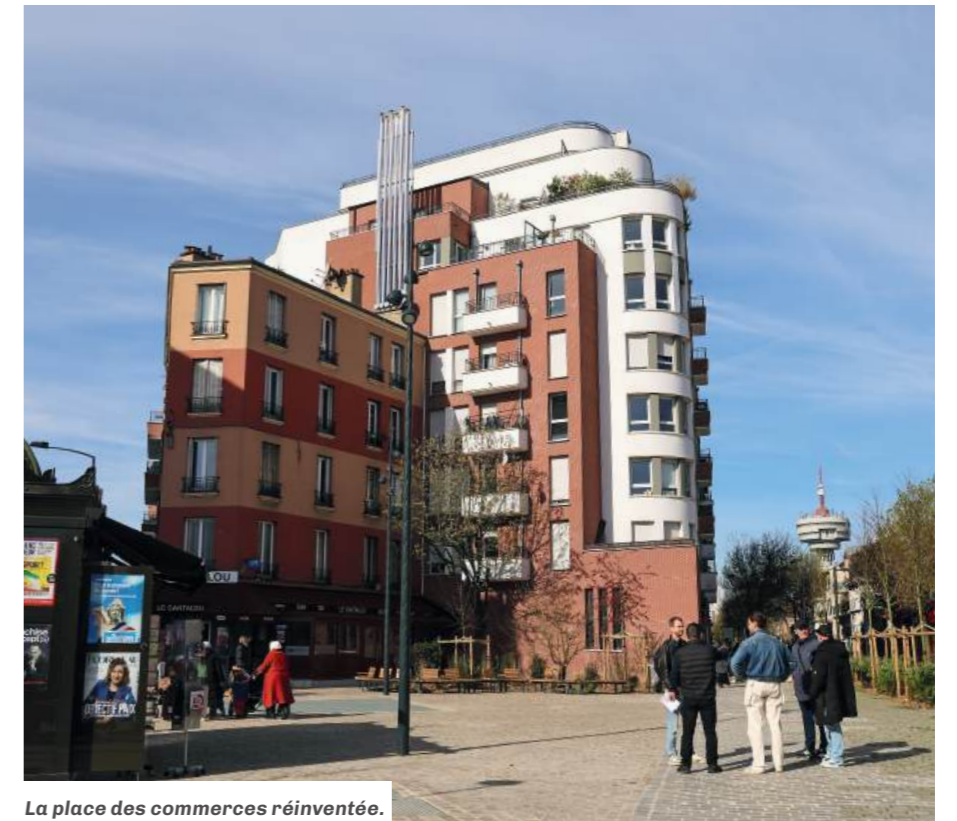
La place des commerces réinventée.

Les deux placettes accueillant le marché seront entièrement rénovées et végétalisées. Comme pour la place des commerces, elles seront aménagées en plateau, avec une chaussée et des trottoirs au même niveau, facilitant les déplacements des personnes à mobilité réduite. Chacune d'elles sera agrémentée d'un arbre entouré d'assises circulaires. Le calendrier des travaux a été spécialement étudié pour limiter l'im-