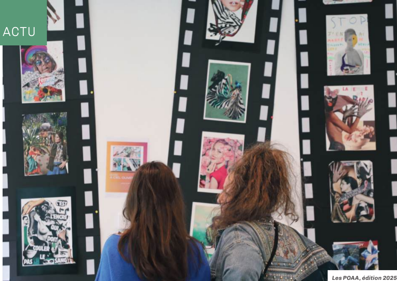
Les POAA, édition 2025.