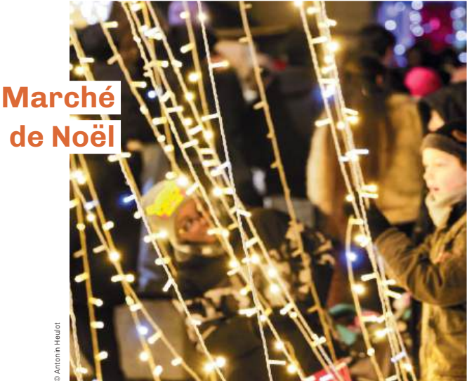
Marché de Noël