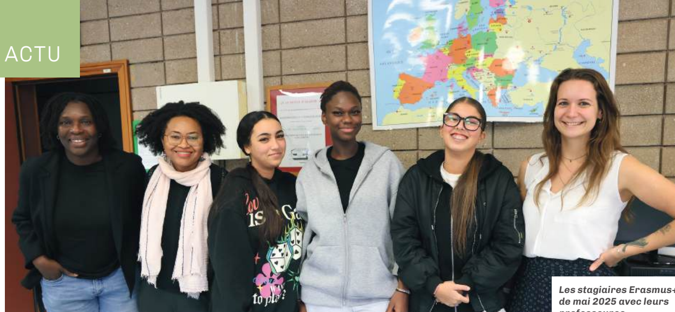
Les stagiaires Erasmus+ de mai 2025 avec leurs professeurs.