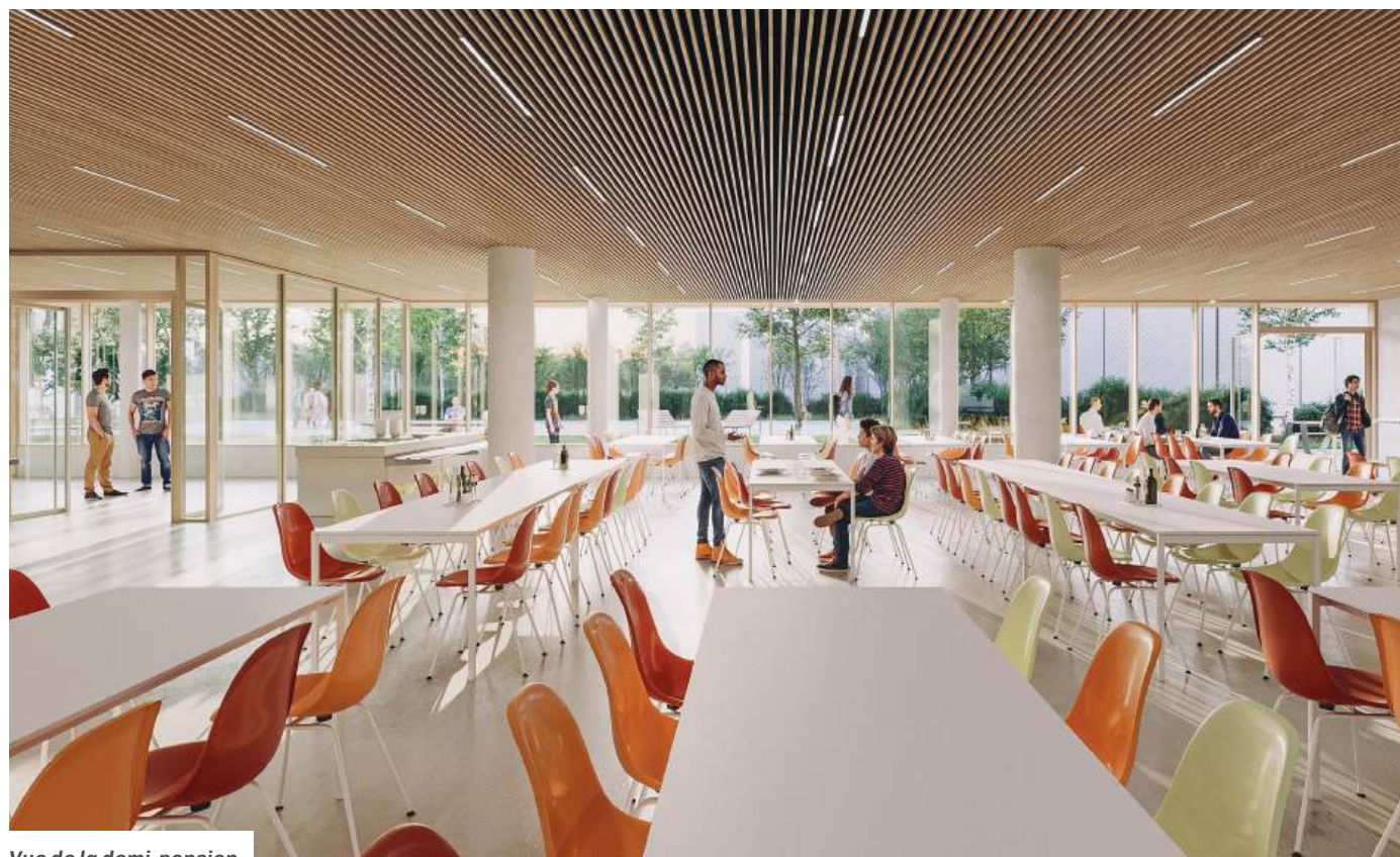
Vue de la demi-pension

Suivi de chantier sur le site de la Région Île-de-France : bit.ly/4pZobOV