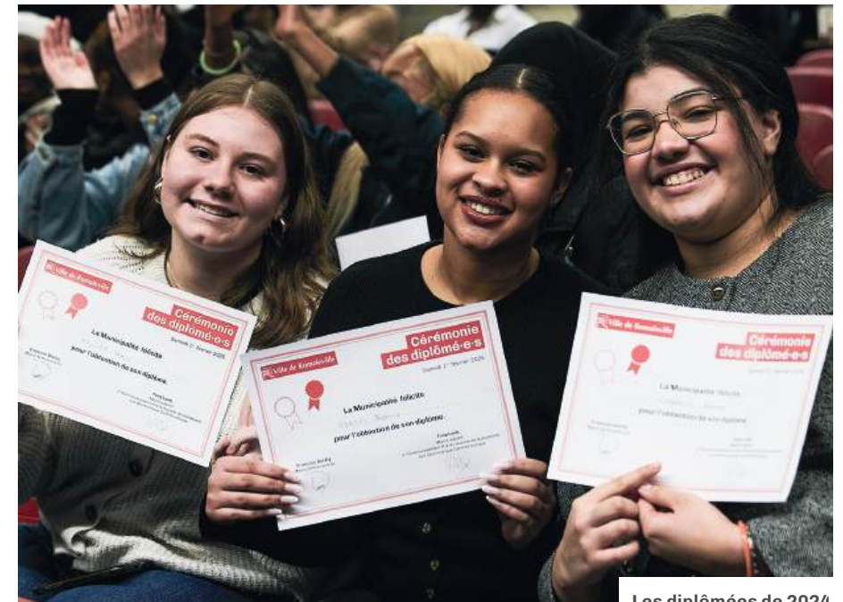
Les diplômées de 2024.

L e 31 janvier, au complexe Alice Milliat, le service Jeunesse mettra à l'honneur les jeunes talents romainvillois lors de sa traditionnelle cérémonie dédiée à tou·te·s les diplômé·e·s ayant obtenu le baccalauréat, un CAP ou un BEP en 2025. Le programme s'annonce festif avec, repas, animations et musique. Les lauréat·e·s pourront échanger avec les élu·e·s de la Ville et se sentir valorisé·e·s pour leurs efforts et leur réussite. Cette soirée est aussi l'occasion pour les jeunes de se rencontrer, de tisser des liens entre quartiers et de découvrir les dispositifs mis en place par la Ville pour les accompagner dans leur avenir. Chacun·e recevra un chèque cadeau et un cadeau utile pour leurs études. Pour être sur la liste des invité·e·s, vous avez jusqu'au 16 janvier pour contacter le service Jeunesse !