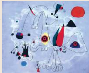
© Femmes et oiseaux au lever du soleil, Joan Miró

7 rue Albert Giry Dès 5 ans Informations et réservation : 01 71 86 60 16 ou mediatheque@ville-romainville.fr