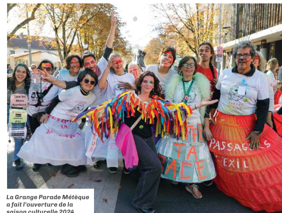
La Grande Parade Métèque a fait l'ouverture de la saison culturelle 2024.

La désormais fameuse parade romainvillo-lilasienne lance un appel à projets pour son édition 2026. Quel que soit le projet artistique et au gré des envies, associations, écoles et particulier-ère-s sont invité-e-s à se rapprocher des organisateur-ric-e-s pour participer au défilé de cette année !