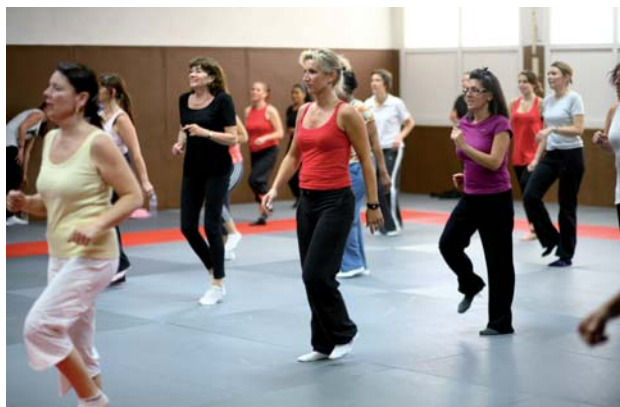
LA SALLE DE GYMNASTIQUE va accueillir les activités 3 ème âge, le club gymnique de Romainville et le Centre d'Éducation Physiques et d'activités sportives (CMEPAS).