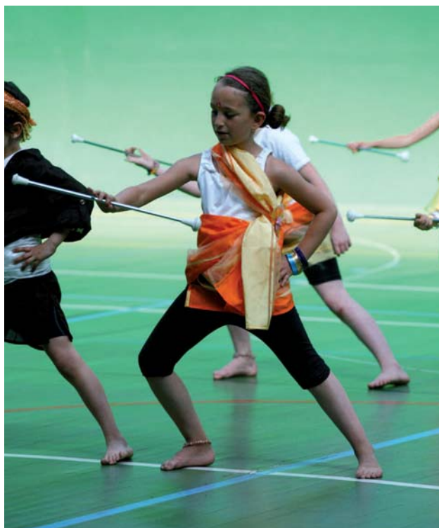
LE PLATEAU SPORTIF va accueillir le club de basket, le twirling « les bâtons d'argent » et Atousports-badminton.

Pour la rentrée 2012/2013 9 associations vont bénéficier de ce nouveau bâtiment en plus des activités scolaires et municipales.