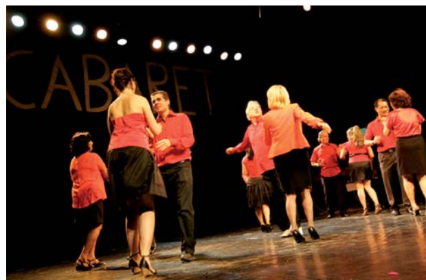
LA SALLE DE DANSE va accueillir l'association Api danse et les activités 3 ème âge.