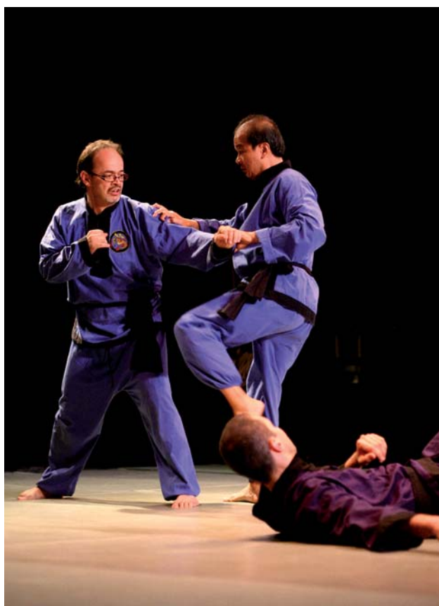
LE DOJO va accueillir le Tenri karaté club de Romainville, le Vo Vietnam Romainville et l'école d'arts martiaux ro-mainvilloise Toreikan budo.