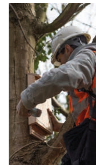
Pose d'un nichoir pendant les travaux

Les travaux de sécurisation du site qui sera ouvert au public ont été menés avec une grande vigilance sur les espèces végétales et animales. De nombreuses mesures ont été prises pour préserver l'environnement. Des habitats de substitution ont notamment été installés pour les oiseaux, les hérissons et les reptiles pendant les travaux.