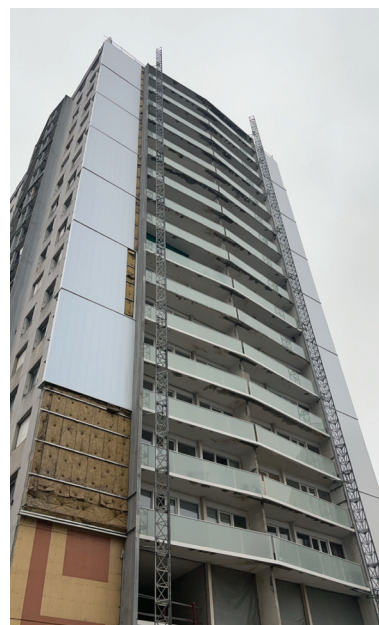
↑ La façade OUEST en cours de travaux

Les travaux sur les façades Nord débiteront au mois d'avril 2024. Les locataires dont le balcon se situe sur la façade Nord seront invités à désencombrer leur balcon afin de permettre la réalisation des travaux. En cas de difficulté (impossibilité de rentrer un meuble par exemple), n'hésitez pas à contacter l'entreprise LEGENDRE, une aide au déplacement sera mise en place.