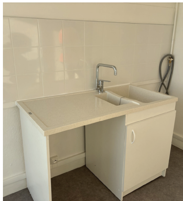
Travaux effectués dans une salle de bain / une cuisine